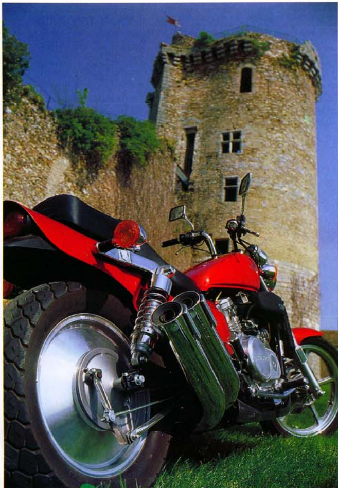
Diaboliquement agressive, la VFC ! Le gros coup de cœur pour la Honda commence par là, une jante et quatre échappements.

Mettons tout de suite hors de cause les moteurs. Souples, ils le sont tous les deux, et répondent à bas régimes sans faire d'histoire. Les embrayages, doux, sont à l'avenant. La commande de celui de la FZX est un peu plus « nerveuse », on sent l'attaque du mécanisme plus franche, mais la progressivité n'en pâtit pas. La différence se fait essentiellement à basses vitesses lors des évolutions sur un fillet de gaz. La VFC, déjà handicapée par sa longueur, gêne son pilote à cause d'une direction trop lourde ayant tendance à l'embarquer. Si l'on met un pied à terre, on est également mis en difficulté, les bras bloqués dans une position où ils luttent contre la lourdeur de la direction et interdisent du même coup une reprise de l'équilibre. Il faut également ajouter à cela une transmission critiquable. Le cardan est sans